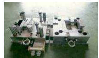
完成品のプラスチックの生産