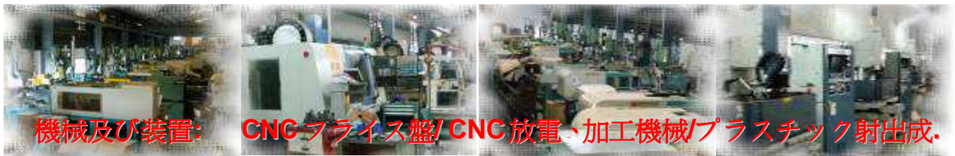
機械及び装置： CNCフライス盤/ CNC放電、加工機械/プラスチック射出成。

金型材料の選定：高靱性、耐摩耗性、鉄鋼生産の高収量、高品質のスウェーデン VIKING 熱処理。ミラー高クロムステンレス鋼、鉄鋼生産の耐食高品質スウェーデンの STA 熱処理。ドイツの M461 と大同株式会社、日本 NAK80 品質 40 度鉄鋼生産。